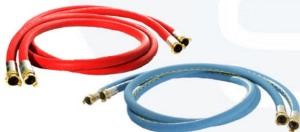
Raccordi con attacchi rapidi GEKA da 1"