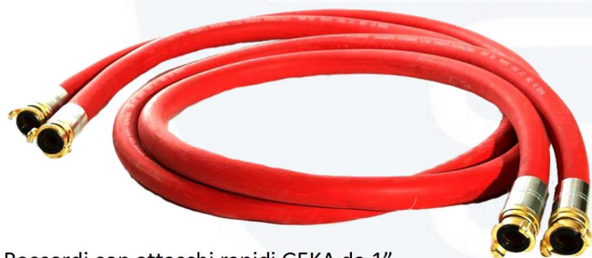
Raccordi con attacchi rapidi GEKA da 1"