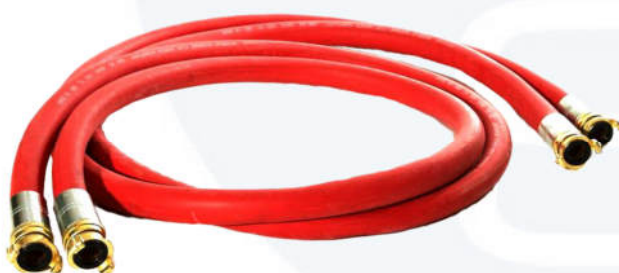
Raccordi con attacchi rapidi GEKA da 1"